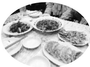
どのお店も美味しい料理でみんな大満腹

目事務局長よりル 加者説明が行われ、 のあいさつがありま 野淳副会長 委員長の小 まり、全員集 者は、実集 丁度開始時間 なりました。 ないっばい めはかけ、に 参加者が、会 前参加者が、と 時には半の午後6 に開始時間