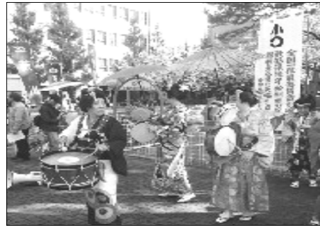
チンドン屋さんの演奏で景気付け

「消費税増税は中止」「最低賃金を引き上げよう」「憲法を守り暮らしに活かせ」と高らかにシュプレヒコールを浅草の町に響かせました。道行く観光客や町の人も笑顔で行進を眺め、多くの人に要求をアピールできました。