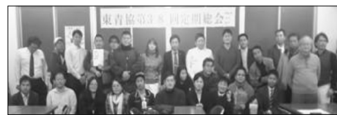
東商連のこれからを担う青年たち

会では業者青年の厳しい現状を受け、集まって話し合える民商青年部を強く大きくすることの必要性を確認しました。江東民商青年部も引き続き頑張ります。