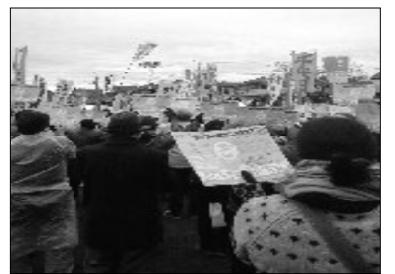
オスプレイ配備ゆるさない参加者の想い一つに