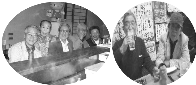
夜の扇橋でみんなが笑顔に

10月27日木曜日、江東民商第1回夜のオリエンテーリングを開催しました。夜オリとは、参加者はグループを作り主催者側から指定されたお店を3件飲み歩くとという企画です。第一回は扇橋周辺での開催でした。今回は9店舗がこの企画に協力してくれました。参加者は36人となりました。江東区では初の試みとあってか、集合場所の千田地区集会所