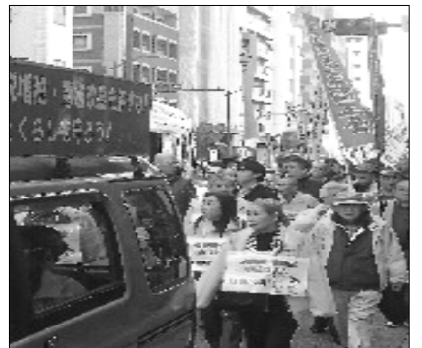
江東民商も元気よく行進

「消費税増税は中止」「最低賃金を引き上げよう」「憲法を守り暮らしに活かせ」と高らかにシュプレヒコールを浅草の町に響かせました。道行く観光客や町の人も笑顔で行進を眺め、多くの人に要求をアピールできました。